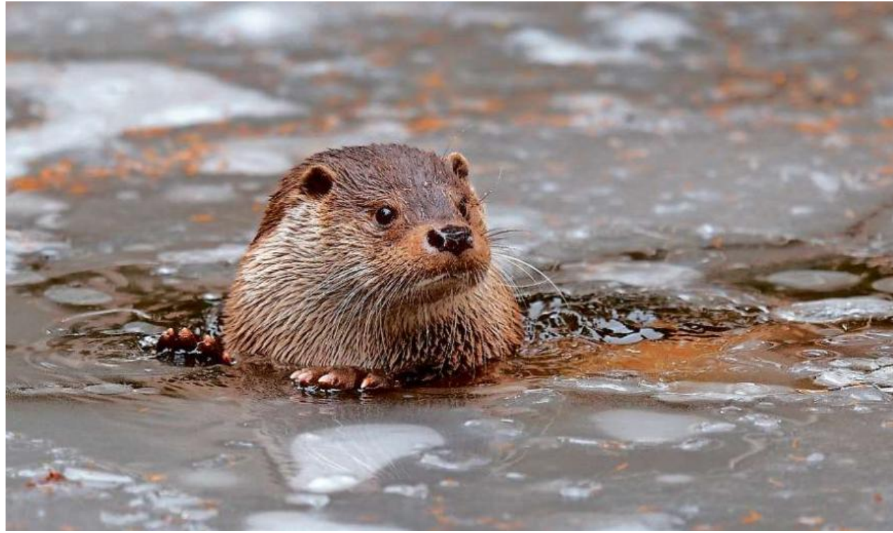
Natürliche Rückkehr: Der Fischotter ( Lutra lutra ) ist auf bestem Weg, sich nach jahrzehntelanger Abwesenheit in heimischen Gewässern wieder anzusiedeln.

Die einzeltägischen Tiere, welche Territorien bis zu 40 Kilometern