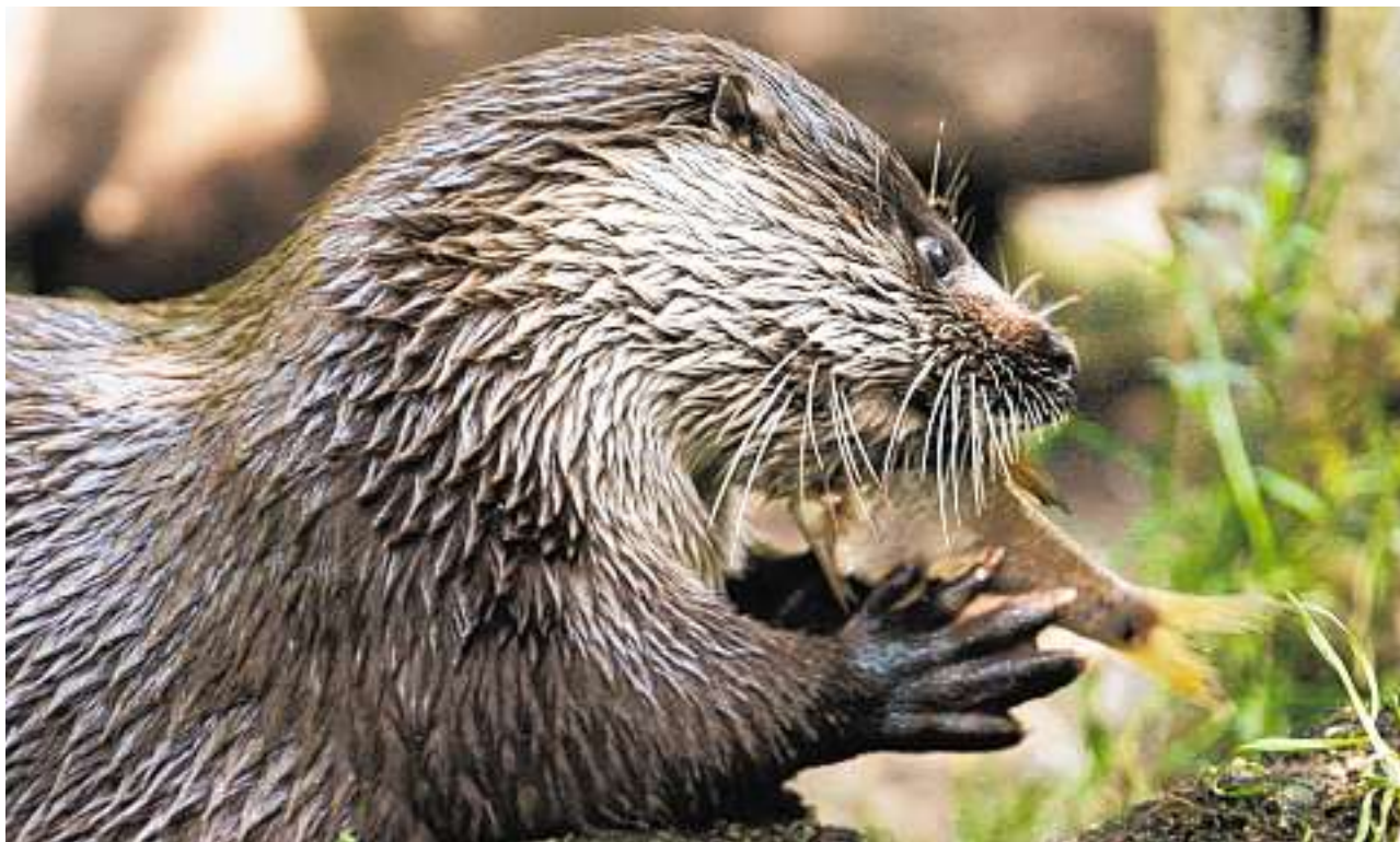
Irgendwann auch wieder in der freien Natur? Ein Fischotter verspeist im Zürcher Zoo eine Forelle.

Mehr Fische dank «Fischnetz+» Die Gründe für den drastischen Rückgang der Fischbestände wurden in einem ersten Projekt unter dem Namen «Fischnetz» untersucht. Die Fischereiberatungsstelle kam zum Schluss, dass unter anderem die Verbauung der Fließgewässer, Veränderungen der Wasserqualität oder der Wassertemperatur für den Rückgang der Fischbestände verantwortlich sind. Jetzt wurde ein Nachfolgeprojekt, «Fischnetz+», lanciert. Dank eines