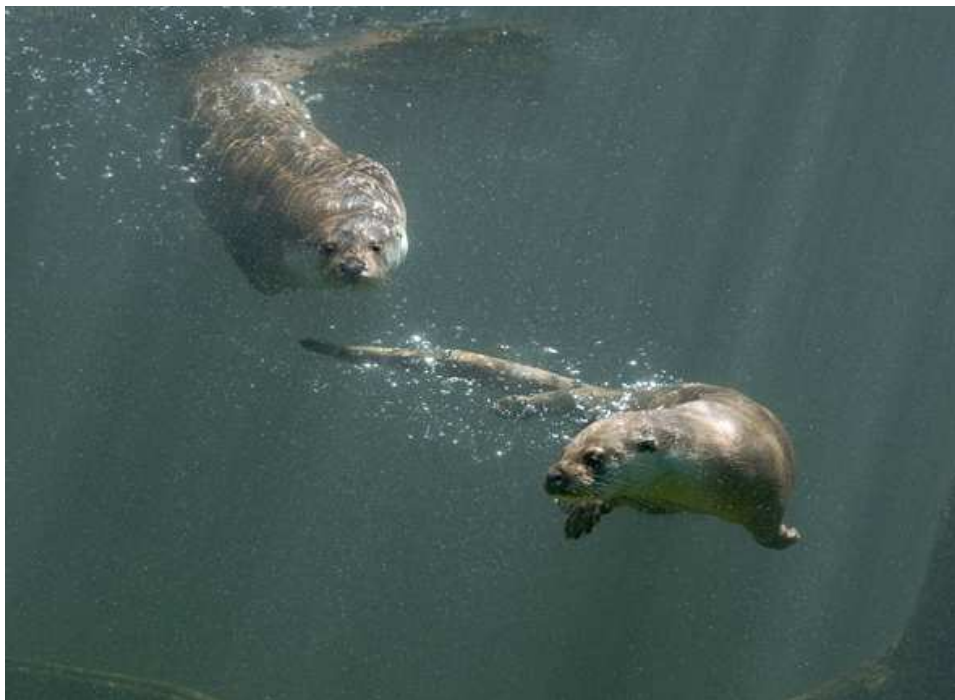
Zwei Fischotter auf Tauchgang im tschechischen Zoo OHRADA, Hluboka nad Vltavou.

Die Jungtiere leben relativ lang, nämlich während ihres ersten Lebensjahrs, im Gebiet der Mutter und erlernen während dieser Zeit alles, was sie für ein selbständiges Leben brauchen. Wenn man also auf mehrere Tiere trifft, handelt es sich meist um einen solchen Familienverband.