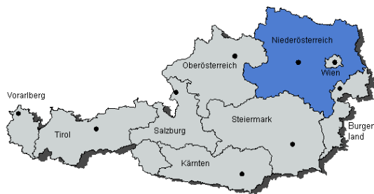
La Basse Autriche (bleu)

Dans le Waldviertel, un territoire au nord-ouest de la Basse Autriche, la loutre n'a jamais disparu. Grâce à l'élevage de poissons en étangs, la loutre a toujours trouvé une nourriture abondante malgré un paysage appauvri. Une amélioration de la qualité des eaux de même qu'une protection efficace des espèces et de l'environnement ont permis un développement positif des effectifs. Ces derniers se sont bien développés en Basse Autriche, comme en témoigne une cartographie de la présence de l'espèce en 1999, où elle se limite au Waldviertel. Dix ans plus tard, en 2008, la loutre est certifiée aussi au sud du Danube (Mostviertel). Dans le même temps malheureusement un recul de la population était constaté au Waldviertel. Depuis 2011/2013, la population semble s'être stabilisée à un niveau d'environ. 600-800 individus.