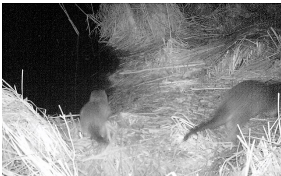
La jeune loutre (animal à gauche) vit dans l'Aar près de Berne.

Une jeune loutre vit depuis peu à nouveau dans l'Aar près de Berne. Des photos ont authentifié l'animal il y a quelques semaines, dans le cadre du monitoring du castor.