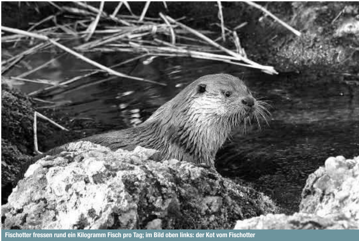
Fischotter fressen rund ein Kilogramm Fisch pro Tag; im Bild oben links: der Kot vom Fischotter

Früher war der Fischotter in der Schweiz heimisch, doch ein 1888 in Kraft gesetztes Bundesgesetz forderte seine Ausrottung: "(...) die Fischotter, die Reiher und alle anderen Tiere, die der Fischerei Schaden anrichten, sind auszurotten." Zu diesem Zweck setzten die Behörden sogar Kopfprämien aus,