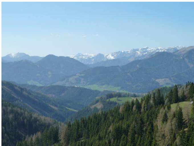
Blick über einen Teil des steirischen Untersuchungsgebiets, vom Rosskegel Richtung Hochschwab. Die Ähnlichkeit mit alpinen und voralpinen Gegenden der Schweiz ist unverkennbar.

Anfang Mai 2011 begann die zweite grosse Fischotter-Fangaktion im Projekt Lutra Alpina. Mit zwei unabhängig voneinander agierenden Teams, beide zusammengesetzt aus erfahrenen Fischotterexperten