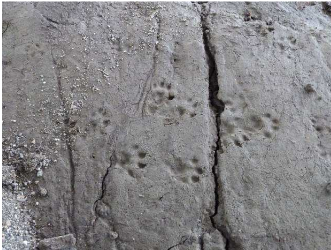
Meist verraten nur Spuren die Anwesenheit der heimlichen Wasserbewohner.

Manchmal aber steht man auf der Brücke, hört das Piepsen lauter werden, freut sich schon und dann kehrt das Tier im letzten Moment um, der Piep wird leiser und es bleibt bis zur nächsten Möglichkeit ein wanderndes Phantom.“